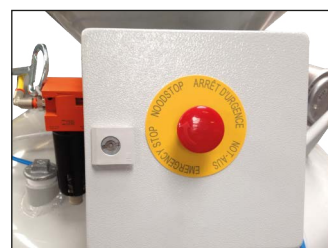
SP 147 CE bedieningskast