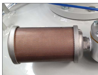
SU 34 ontvluchtkraan