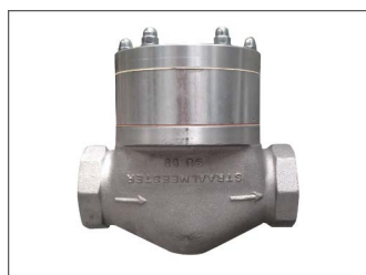
SU 98 hoofdvluchtkraan

De ketel is voorzien van een bedieningskraan die het mogelijk maakt de straalmiddelkraan te sluiten, waardoor afblazen van een werkstuk mogelijk is.